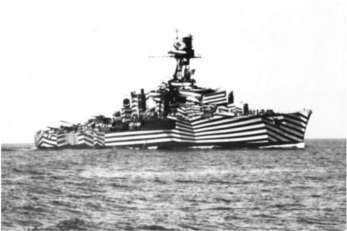
1. Franse boot: de Gloire