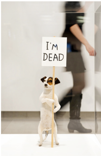
2. David Shrigley, 'I'm Dead' (2010)

http://artcollc.blogspot.com/2009/01/razzle-dazzle.html