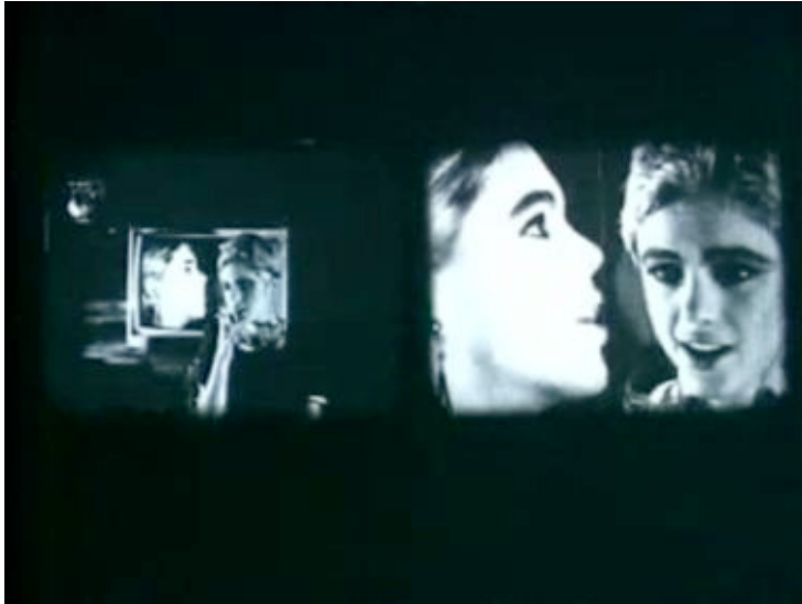
Andy Warhol, Outer and Inner Space, 1965 © Andy Warhol