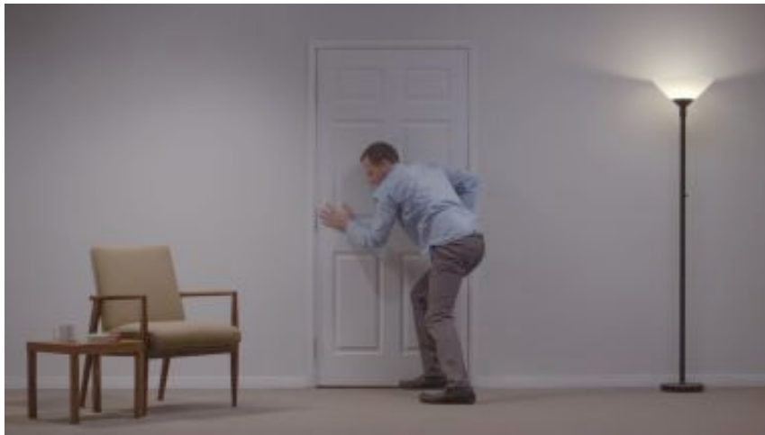
Bill Viola, Angel at the Door , 2013, Photo: Kira Perov, copyright the artist and courtesy of the artist and Blain|Southern

naar een hoger, symbolisch niveau. Hij tracht fundamentele waarheden uit te drukken, maar slaagt er niet eens in om uit zijn eigen geësthetiseerde nepwereld te breken.