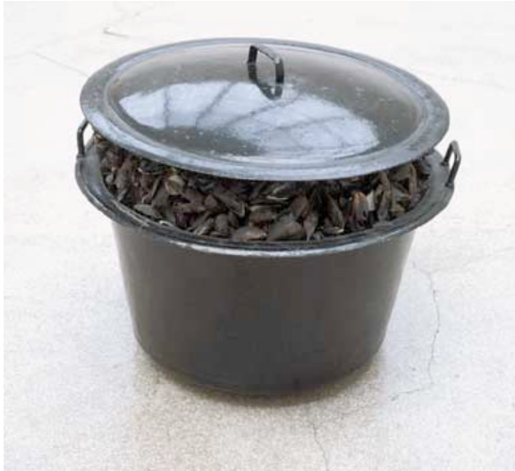
4. De grote mosselpot - Marcel Broodthaers