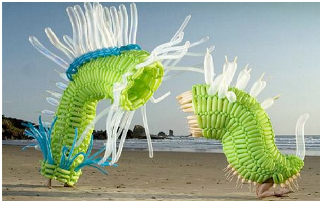
5. Ballonenkunst - Jason Hackenwerth

http://www.uitinvlaanderen.be/uitgelicht/la-grande-casserole-de-moules-marcel-broodthaers-1966